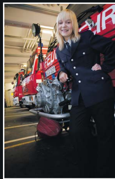
hat recht. Vielleicht können sich ja auch die Kritiker – oder besser Skeptiker – mit diesem Gedanken anfreunden.

kann. Ich sehe mich auch nicht unbedingt als eine knallharte Frau, die unter Atemschutz in brennende Häuser läuft und mit zwei Menschen auf der Schulter wieder hinauskommt, als wäre es das Normalste der Welt. Aber mittlerweile ist die Feuerwehr zu meinem liebsten Hobby geworden – und ich möchte die Feuerwehr und die Menschen, die ich dort kennengelernt habe, nicht mehr missen. Ein Kamerad und inzwischen guter Freund hat vor Kurzem zu mir gesagt: „Es gibt viele Bereiche bei der Feuerwehr, in denen man helfen kann, und Positionen, die mindestens genauso wichtig sind. Jeder wird seinen Platz in der Feuerwehr finden – wenn er will!“ Ich habe mir diese Worte reiflich durch den Kopf gehen lassen und ich finde, mein Kamerad