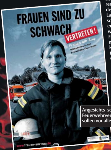
Angesichts schrumpfender Beitrittszahlen wirbt der Deutsche Feuerwehrverband verstärkt um Mitglieder. Neue Kampagnen sollen vor allem Frauen für den freiwilligen Dienst begeistern.